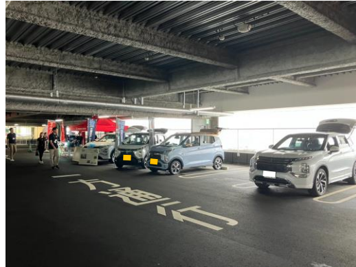
▲試乗車の様子（三菱）