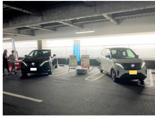
▲試乗車の様子（日産）